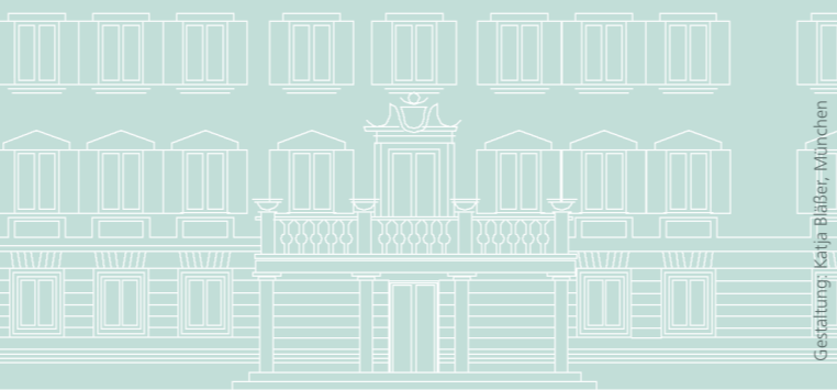
Gestaltung: Katja Bläber, München

Zur Akademie geht man vom Bahnhof aus in etwa 10 Minuten: Bahnhofstraße, Hallberger Allee, Hauptstraße, Schloss-Straße